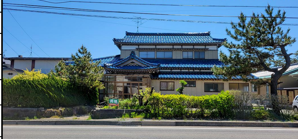
【T44】 西目町出戸字浜山3-169