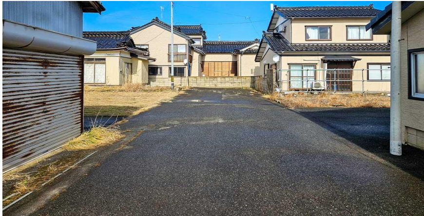
前面道路(金浦町所有の位置指定道路)