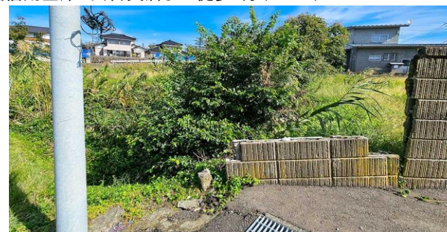
土地北側隣地との境界が定かではないため、引渡し前に境界の復元を行います。

西目郵便局まで徒歩8分(650m) 羽後信用金庫 西目支店まで徒歩9分(700m)