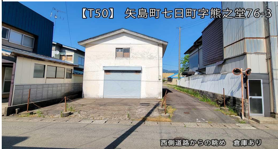
【T50】 矢島町七日町字熊之堂76-3

矢島郵便局まで徒歩11分(850m) 羽後信用金庫 矢島支店まで徒歩7分(550m) 秋田しんせい農業協同組合 矢島支店まで徒歩6分(500m) 秋田銀行 矢島支店まで徒歩9分(650m) 大井病院まで徒歩6分(500m) 佐藤医院まで徒歩5分(400m)