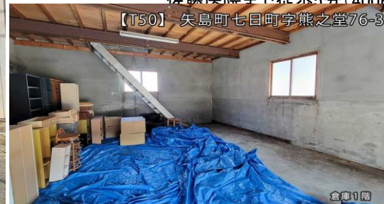
【T50】 矢島町七日町字熊之堂76-3