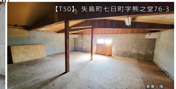
【T50】 矢島町七日町字熊之堂76-3