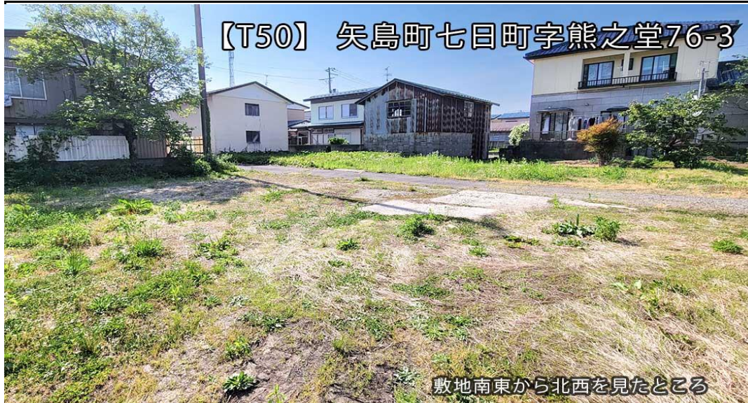
【T50】 矢島町七日町字熊之堂76-3