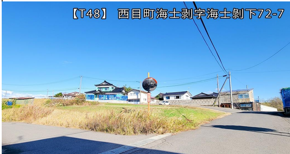
【T48】 西目町海士剥字海士剥下72-7

お食事 麺所 美徳まで徒歩2分(130m) 海士剥簡易郵便局まで徒歩6分(450m) 西目郵便局まで徒歩30分(2.4m) 羽後信用金庫 西目支店まで徒歩27分(2.1km)