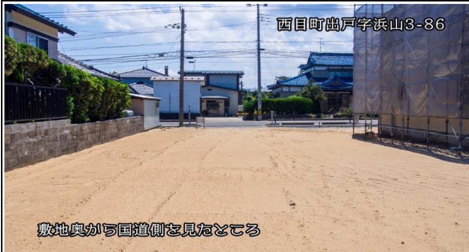
敷地奥から国道側を見たところ