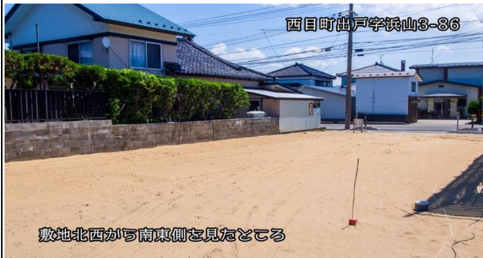
敷地北西から南東側を見たところ