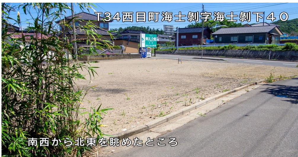
南西から北東を眺めたところ