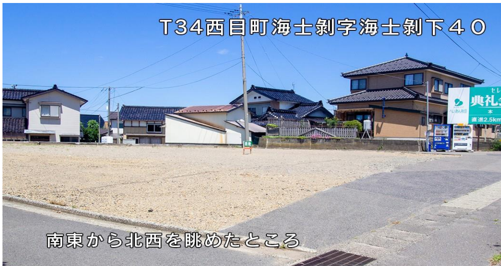
南東から北西を眺めたところ