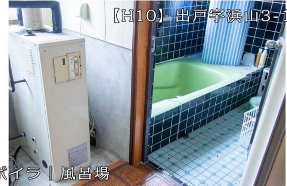
ボイラ | 風呂場